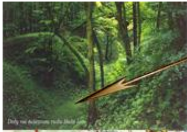
Ložiska železné rudy Babí lom a Červené bláto