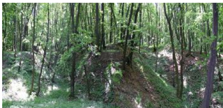
Haldy hlusiny a zbytky početných stolů představují dlouholeté úsilí horníků.