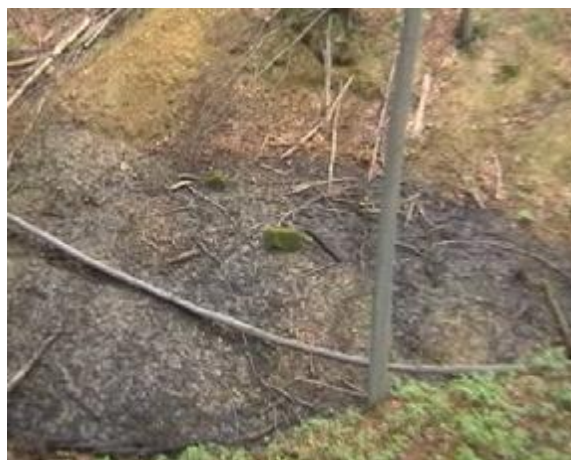
Níže se nachází bahňité jezírko s kameny pilířů bývalé lávky a tři vodní prameny.