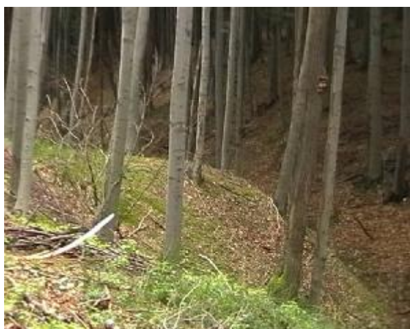
Pod jezírkem je zbytek hráze, která podle odhadu zadržovala více než 10 000 m 3 vody.