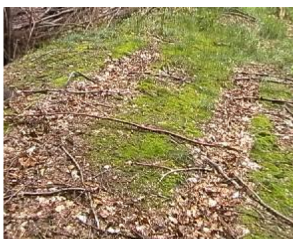
Stopy vyjetých kolejí na hřbetu hráze dosud ukazují, že po ní kdysi vedla i vozová cesta.