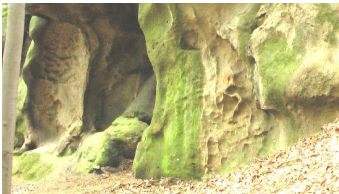
Plastika posledního soudu s křížem vlevo, kropenka, výklenek pro kříž a spoutaný drak vpravo na nedalekých skalách, tematicky odpovídají invocacím benediktínského kříže.