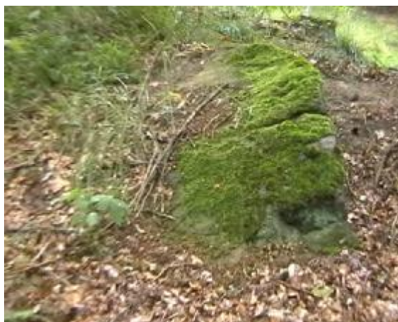
Kameny jednoho z mnoha obydlí ležících v jihovýchodním svahu pod Mýtem.