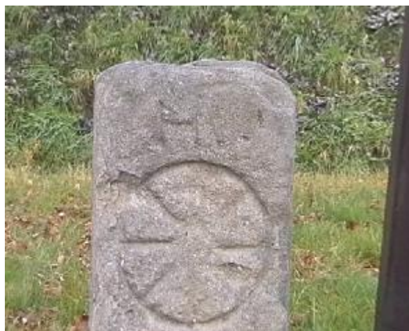
Kámen, označující mýto, měl na líci vyrytý obraz znázorňující kolo vozu, nikoliv kříž.