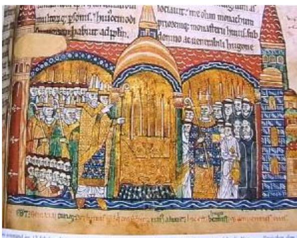
Papež Řehoř Veliký posílá Benediktíny evangelizovat Evropu, iluminace z 12.stol.

Mýto může být jedna z nejstarších křesťanských památek v naší republice.